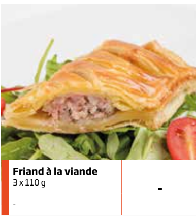
Friand à la viande 3 x 110 g