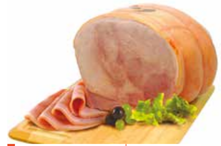
Jambon sup. miche sans sel nitré et sans conservateur ajouté AC - 8,5 kg env.