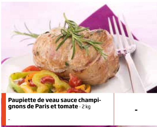
Paupiette de veau sauce champignons de Paris et tomate - 2 kg