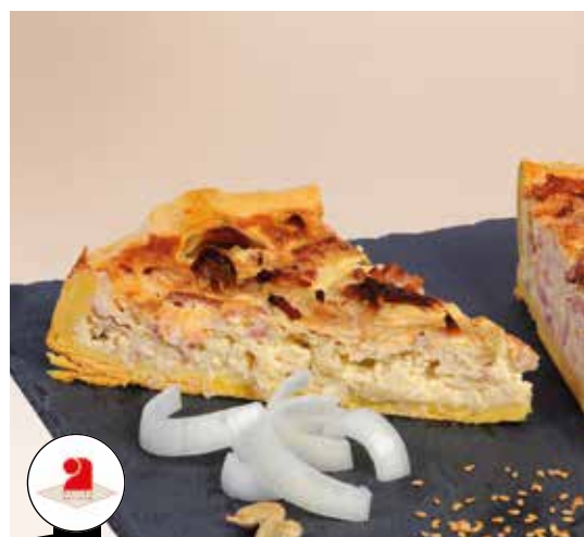
Tarte à l'oignon 2 kg