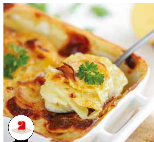
Gratin dauphinois Ultra-Frais 2,9 kg