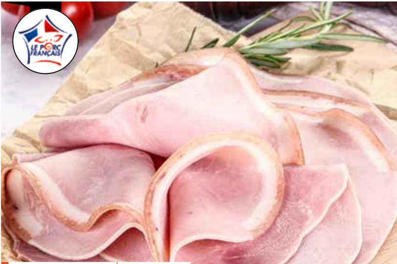
Jambon cuit sup. AC 120 g