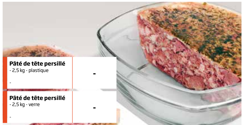
Pâté de tête persillé - 2,5 kg - plastique