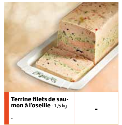
Terrine filets de sau- mon à l'oseille - 1,5 kg