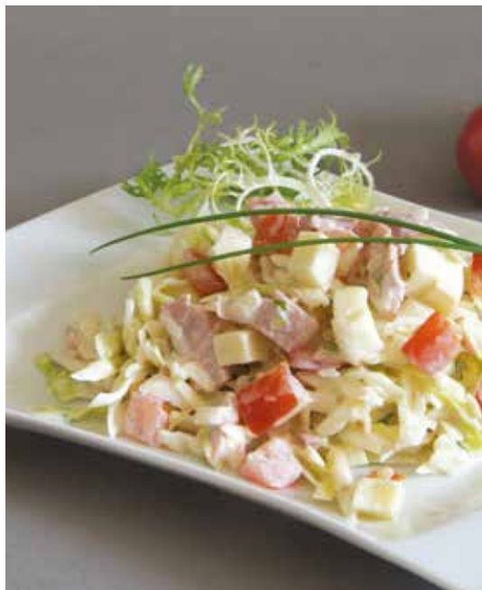
Trio chou-jambon-comté 2,5 kg