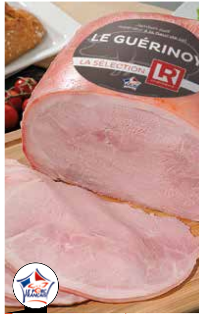
Jambon cuit sup. AC 3 Noix TI - Le Génoy - 6,5 kg