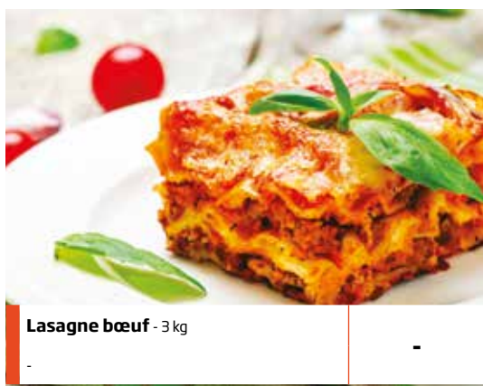
Lasagne bœuf - 3 kg