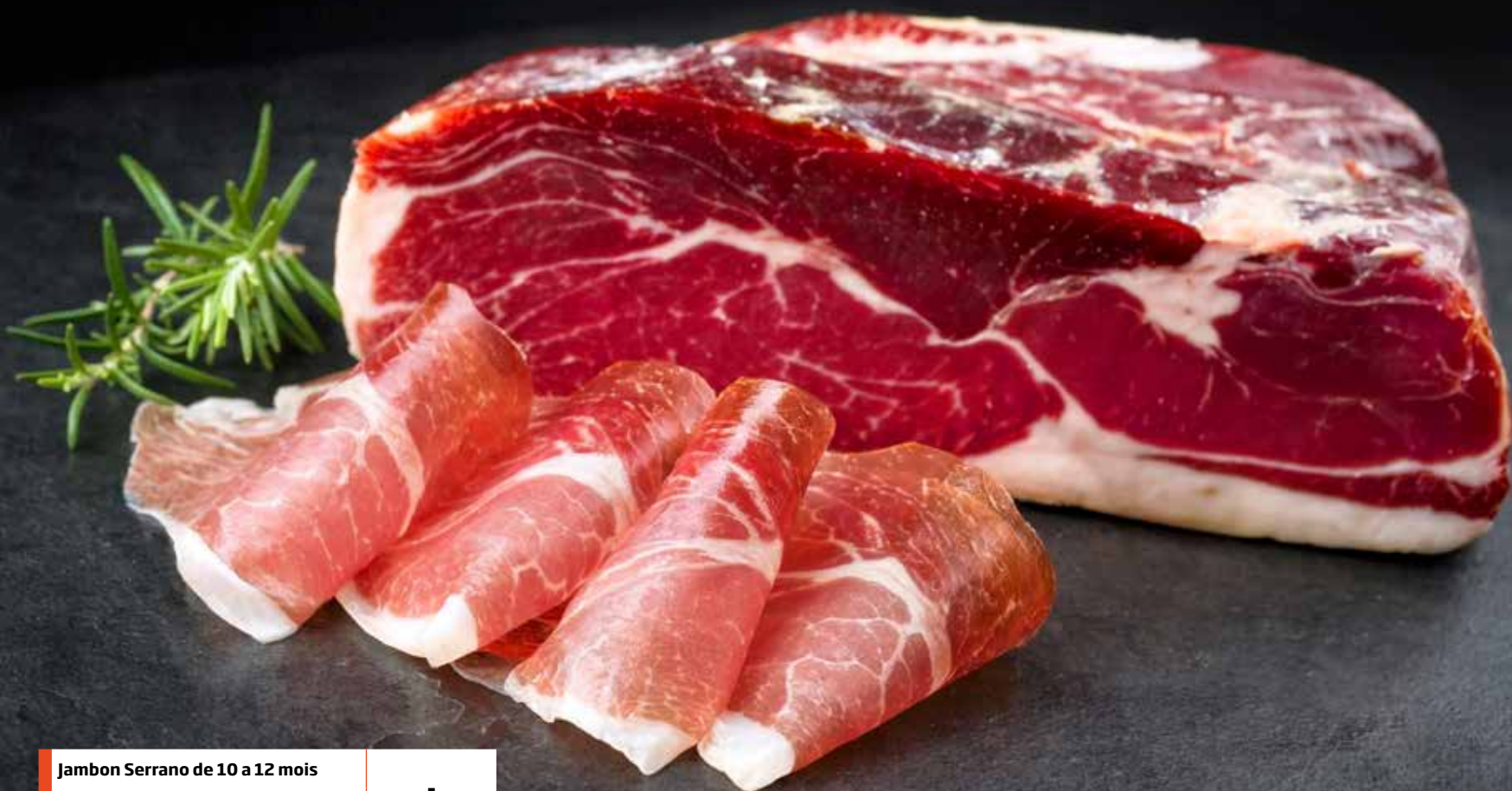
Jambon Serrano de 10 a 12 mois