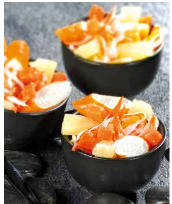
Duo ananas & carottes au surimi 2,5 kg