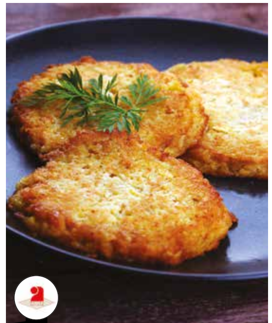
Galettes de pommes de terre 20 x 120 g