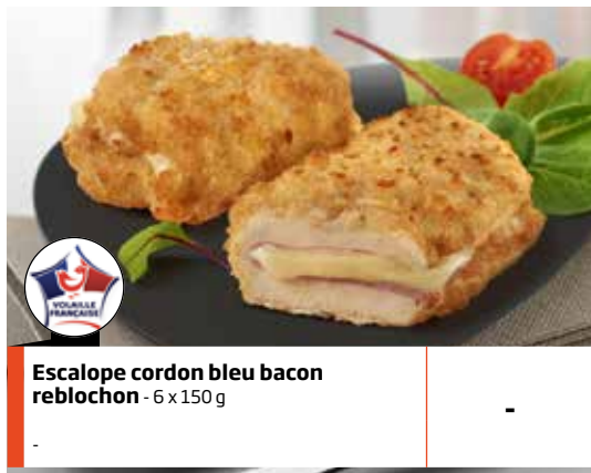
Escalope cordon bleu bacon reblochon - 6 x 150 g