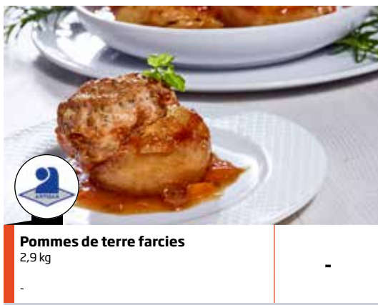
Pommes de terre farcies 2,9 kg