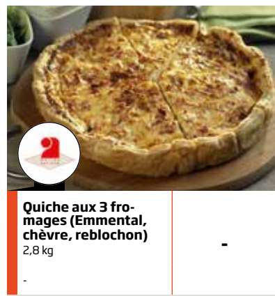
Quiche aux 3 fro- mages (Emmental, chèvre, reblochon) 2,8 kg