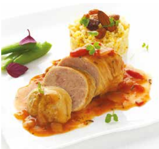
Paupiette de lapin jus tomate et farigoulette - 1,6 kg