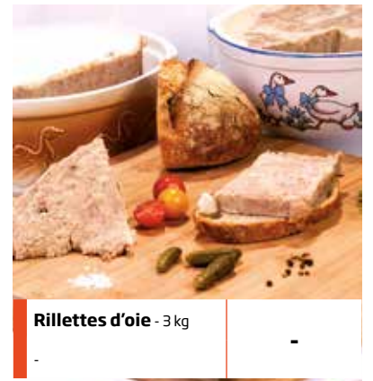
Rillettes d'oie - 3 kg