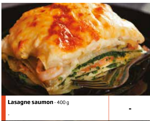
Lasagne saumon - 400 g