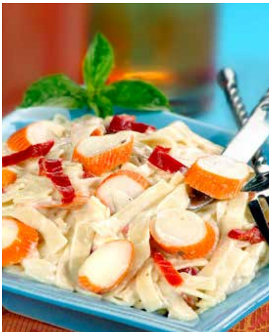
Tagliatelles au surimi (Marco Polo) 2,5 kg