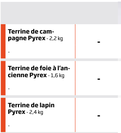
Terrine de cam- pagne Pyrex - 2,2 kg