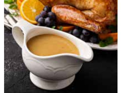
Sauce madère - 1 kg