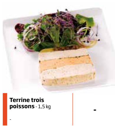
Terrine trois poissons - 1,5 kg